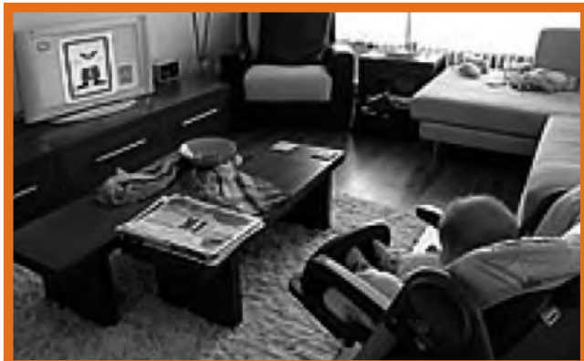
Tous les avis sont unanimes : les chaînes pour bébé présentent un caractère dangereux.